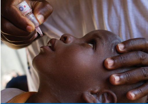
Nijerya’da Rotaryenler tarafından çocuk felci aşısı tatbik edilirken

Üyelerimizin ve diğerlerinin Vakfa olan katkıları, ihtiyacı olan topluluklara sürdürülebilir bir değişim getirmemizi sağlıyor. Kulübünüzün Rotary Vakfı komite başkanına danışın veya Vakfımızı nasıl destekleyebileceğinizi öğrenmek için rotary.org/donate adresini ziyaret edin. Daha fazla bilgi edinmek için Rotary Vakfı Başvuru Kılavuzunu indirin veya Rotary’in Öğrenim Merkezinde Rotary’s Learning Center kursuna katılın.