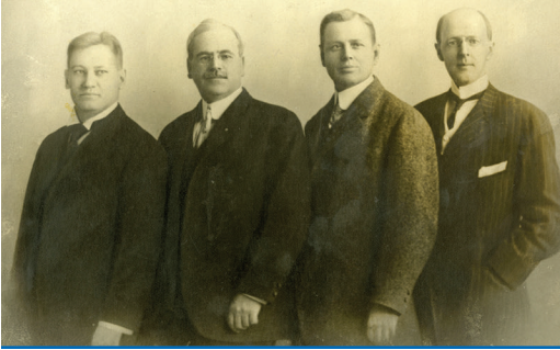
İlk dört Rotaryen: Gustavus Loehr, Silvester Schiele, Hiram Shorey ve Paul P. Harris, yaklaşık 1905-12.

100 yılı aşkın bir süredir tarih yazıyoruz ve dünyamızı birbirine daha yakın hale getiriyoruz. İlk Rotary kulübü 1905 yılında Paul Harris adlı bir avukat tarafından ABD'nin Chicago kentinde başlatıldı. Harris, fikir alışverişinde bulunmak ve tanıdık bir çevre oluşturmak için farklı geçmişlere ve becerilere sahip bir grup uzmanı bir araya getirmek istedi. Ağustos 1910'da, ABD'deki 16 Rotary kulübü, şu anda Rotary Uluslararası olan Ulusal Rotary Kulüpleri Birliği'ni kurdu. 1912'de Rotary birkaç ülkeye daha yayıldı ve Temmuz 1925'te altı kıtada Rotary kulüpleri kuruldu. Bugün dünyadaki hemen hemen her ülkede 35.000'den fazla kulüp vardır. Rotary'nin geçmişi hakkında daha fazla bilgi için, rotary.org/history .