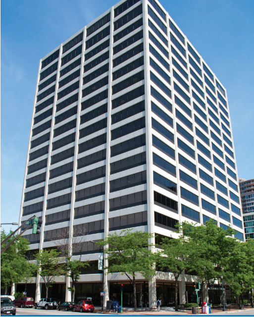
Evanston'daki One Rotary Center, Illinois, ABD

Uluslararası Rotary, genel sekreteri ve dünyadaki kulüpleri ve bölgeleri desteklemek için çalışan yaklaşık 800 çalışanı içeren müdürlük tarafından yönetilmektedir. Rotary'nin dünya genel merkezi, One Rotary Center adlı bir binada, ABD'nin Evanston kentinde bulunmaktadır. 190 kişilik bir konferans salonu, Rotary arşivleri ve UR Yönetim Kurulu ve Rotary Vakfı Mütevelli Heyeti ve UR başkanının ve diğer kıdemli yöneticileri için konferans odalarına sahip bir yönetim ofisi içermektedir.